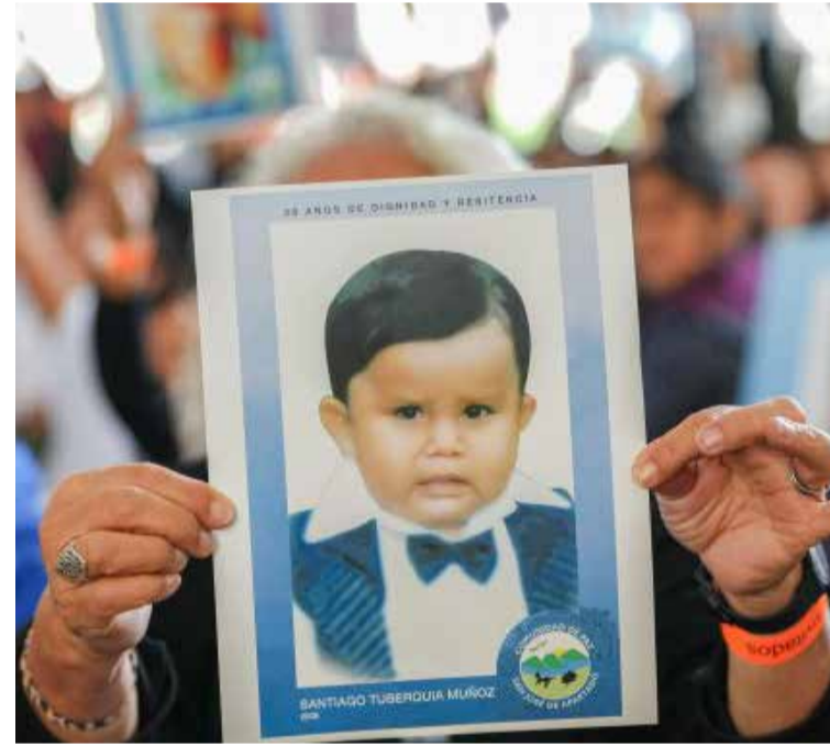
Con este gesto, el Estado colombiano reitera su compromiso con un nuevo camino, cimentado en la verdad, la justicia, la reparación y la garantía de no repetición.