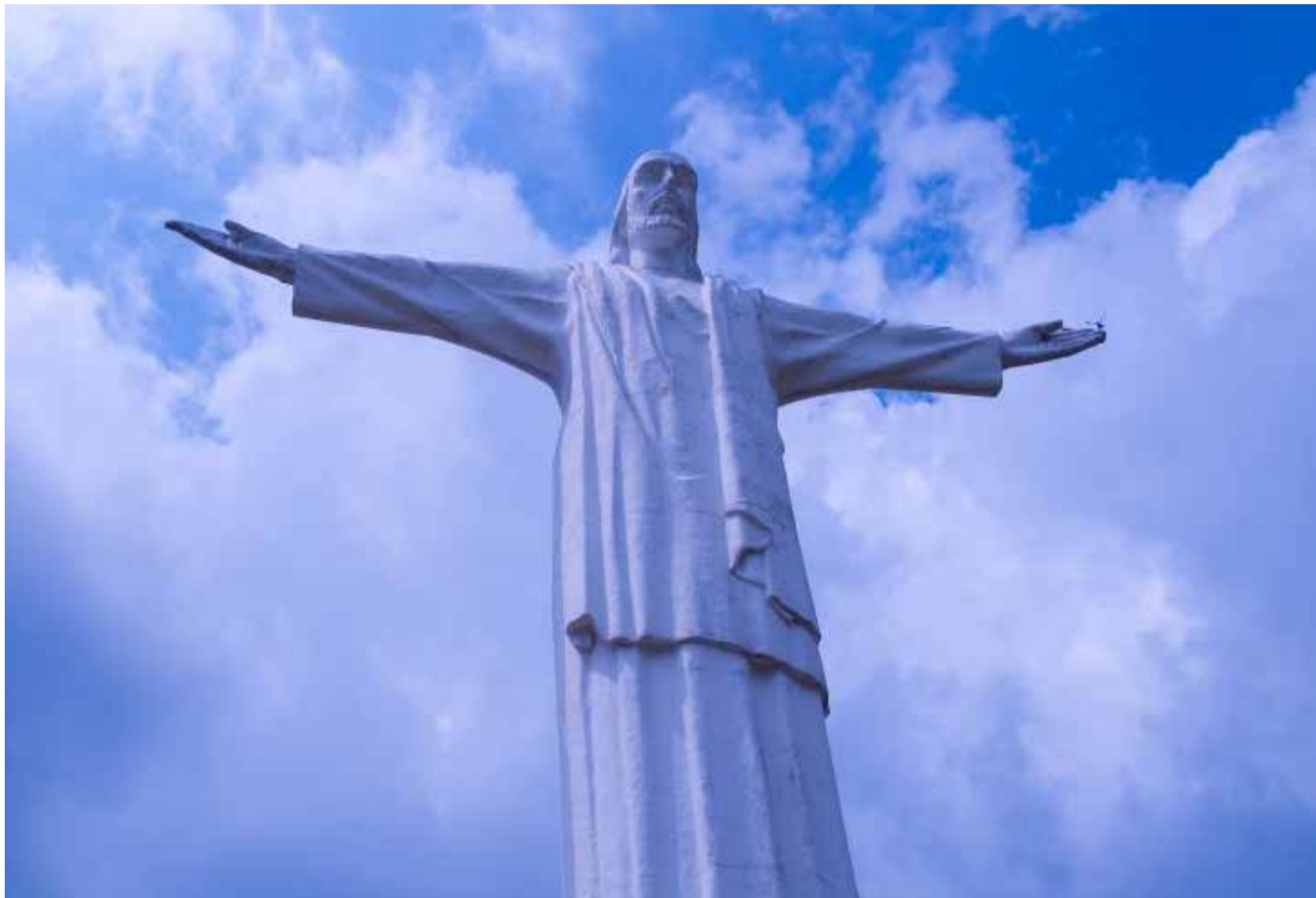
Cristo Rey: Un Ícono de Paz y Mirador Majestuoso sobre Cali