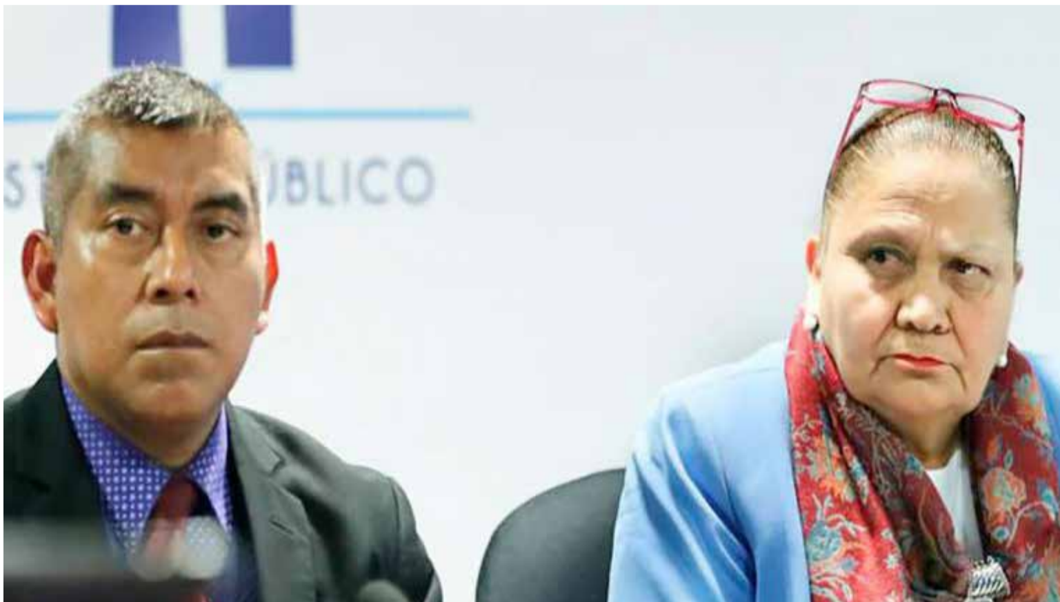
La corrupción y el crimen se tomaron la fiscalía de Guatemala, hasta el presidente de ese país, César Bernardo Arévalo de León, rechazó la orden de captura contra la Fiscalía de Guatemala contra Iván Velásquez y Luz Adriana Camargo