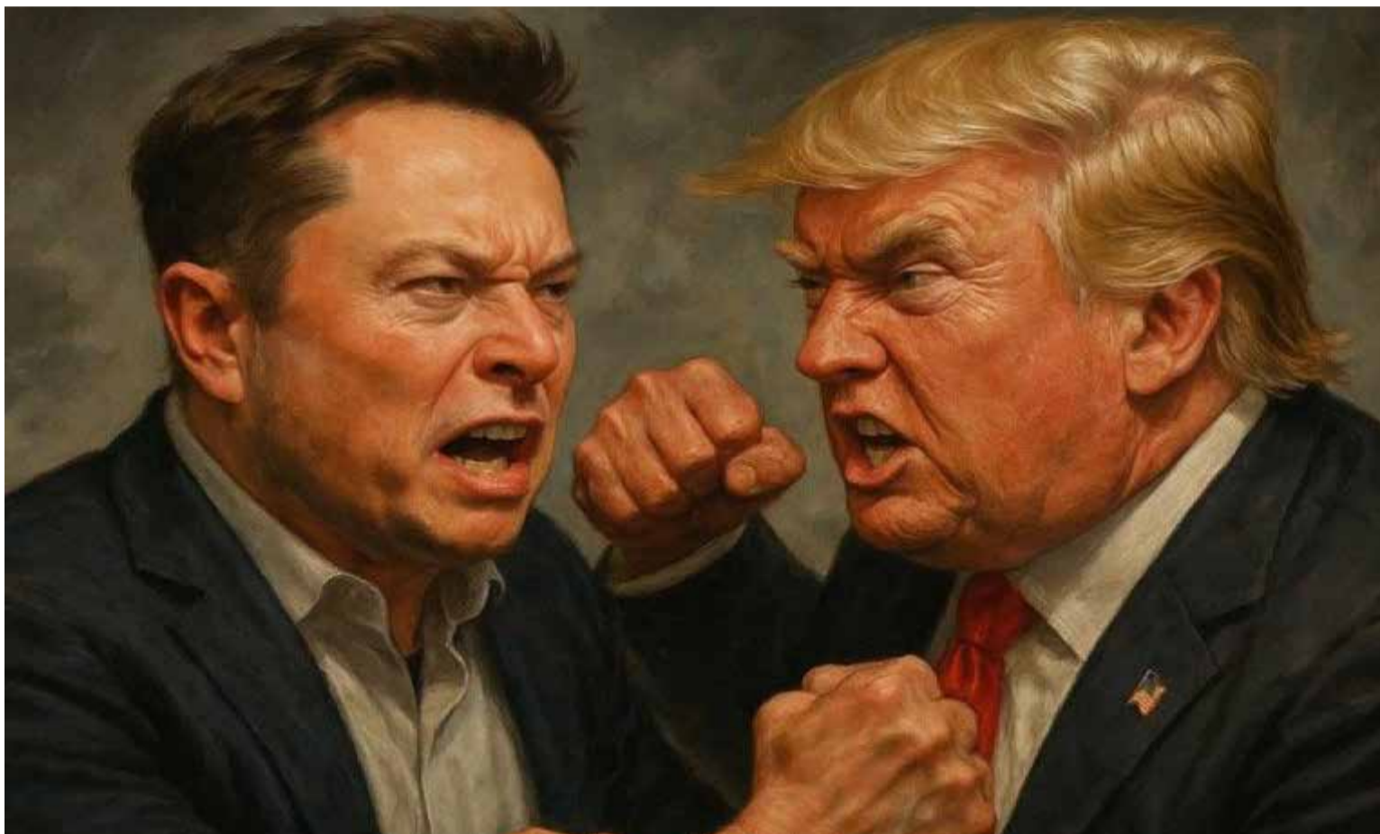
«Elon no va a comprarme»: Trump. Elon Musk, dijo que era hora de «soltar la bomba verdaderamente grande», agregando luego que el hecho de que el presidente supuestamente apareciera en los archivos de Epstein era la razón por la que los mismos no se habían hecho públicos.

La dinámica entre Donald Trump y Elon Musk, dos de las figuras más influyentes y polarizantes de la esfera pública global, ha sido cualquier cosa menos lineal. Marcada por fluctuaciones entre la aparente admiración y la acidez de las críticas públicas, su «pelea» va mucho más allá de la reciente mención de Trump en los archivos de Jeffrey Epstein, revelando un complejo entramado de ambiciones políticas, personalidades arrolladoras y un innegable choque de egos.