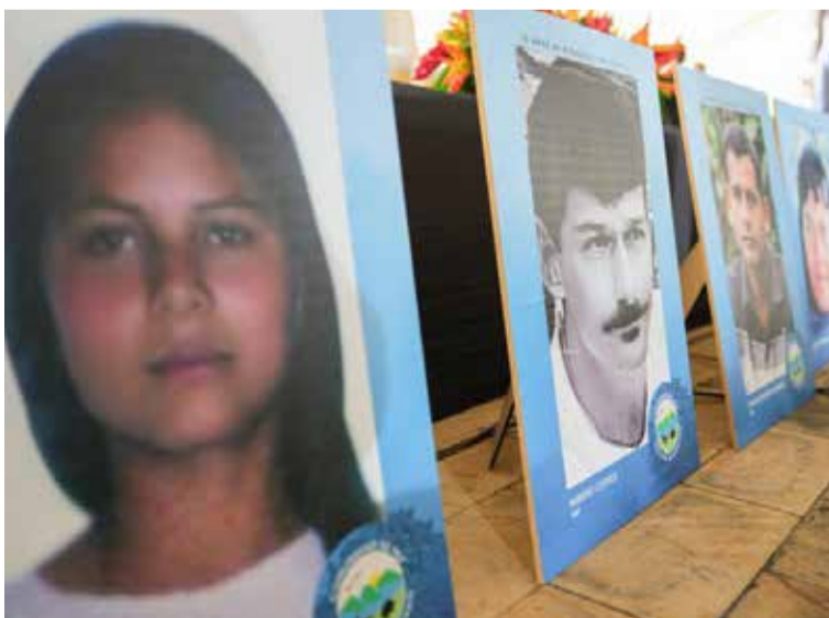
Este acto simbólico no solo busca honrar a las víctimas y reconocer el daño, sino también sentar las bases para la no repetición de hechos tan dolorosos.