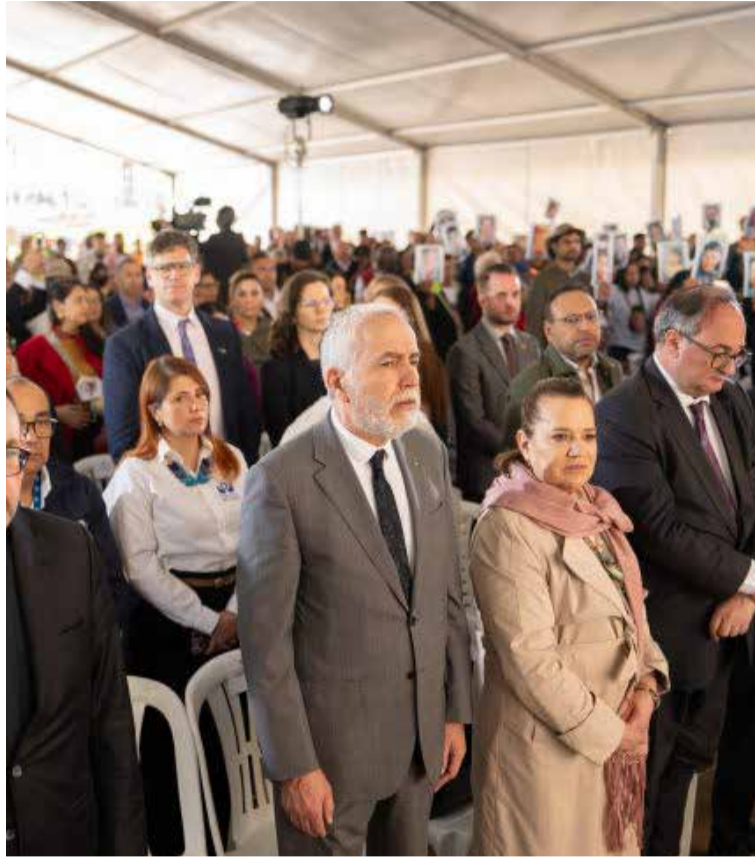
La ceremonia, celebrada en la Plaza de Armas de la Casa de Nariño, contó con la presencia de la Comunidad de Paz, miembros del gabinete ministerial, funcionarios públicos, embajadores, alcaldes de ciudades europeas, líderes internacionales por la paz, y numerosas organizaciones de derechos humanos.

tado de Colombia, todo en sus tres poderes, tiene que servirle al pueblo, no creerse el rey». De no ser así, sentenció, «el discurso es hipócrita» y el propio acto de perdón que él ofrece se vuelve «falso», pues «no es el Estado de Colombia el que está pidiendo perdón aquí, es el presidente de Colombia, al cual detestan todos o las mayorías de los poderes».