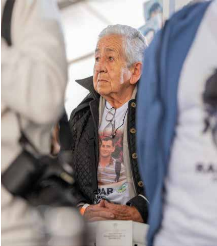
Tras años de persistencia, el acuerdo de diciembre de 2024 finalmente selló el reconocimiento de la responsabilidad estatal y estableció medidas concretas de reparación, incluida la creación de una nueva Comisión de Evaluación de la Justicia.