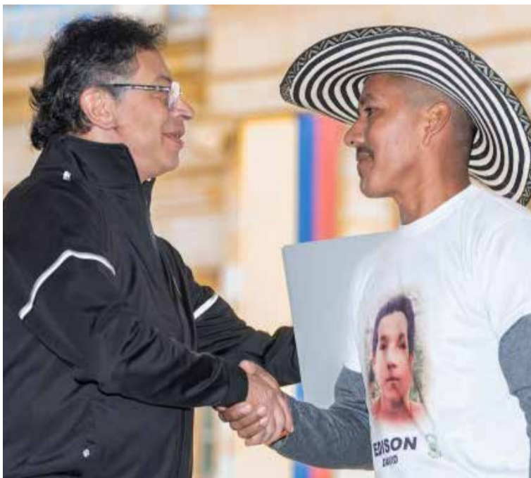
En paralelo al reconocimiento, el Gobierno avanza en otros compromisos del acuerdo, como la formalización de tierras, la adecuación de caminos rurales, la mejora de instituciones educativas y la construcción de un centro de salud, todo en concertación con la comunidad.

La Comunidad de Paz de San José de Apartadó, nacida en 1997 como un bastión de resistencia civil no armada, proclamó su neutralidad frente al conflicto y su derecho a vivir en paz.